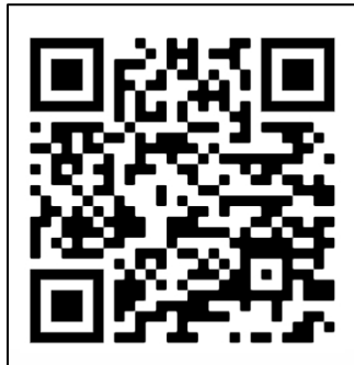
งบการเงินปี 2567